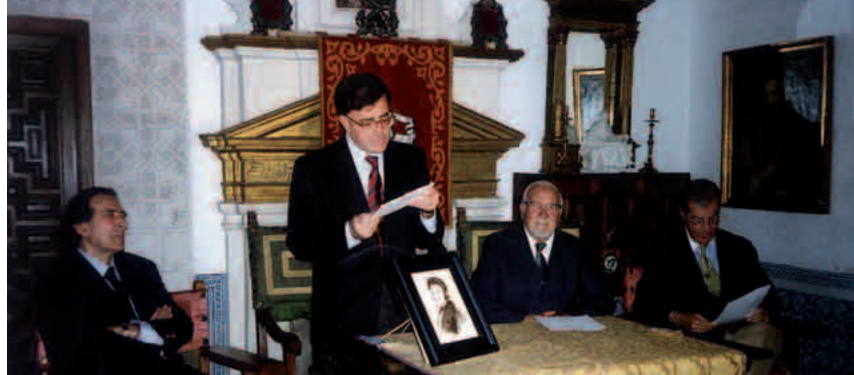
RSBAPen bilera batean, 2005ean

1992an, beste zenbait lagunekin batera, Landazuri elkarte sortu zuen, eta izen bereko aldizkariaren zuzendaria izan zen. 2008an, hil baino astebete lehenago, oho-rezko lehendakari izendatu zuen elkarteak.