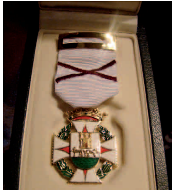
Gasteizko urrezko domina, 2008

Bera izan zen, bestalde, Euskaltzaindiak 2008an Iruñean egin zuen XVI. Nazioarteko Biltzarraren sustatzailea, eta antolatzailer nagusietarikoa.