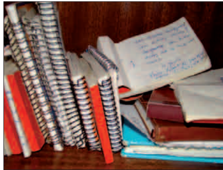
Henrikeren egunerokoak eta kaier famatuak

manerako itzulpenen bat egin zuen, eta, adibidez, Hannoren herensugetxo a berak euskaratu zuen alemanetik, 1995ean.