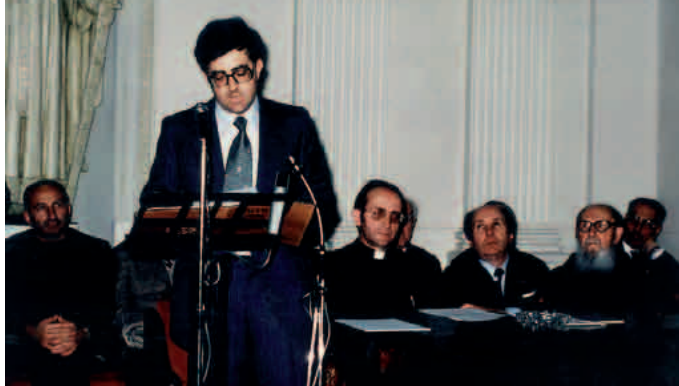
Euskaltzaindiko sarrera-hitzaldian, 1978an