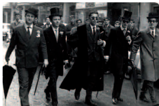
Ikasle-jai batean, Gasteizen

1981ean lizentziatu zen, Filosofia eta Letretan, Filosofia Hutsa zeritzan atalean, Madrilgo Complutense Unibertsitatean, Alfred N. Whitehead filosofoaren epistemologia gai zuen Memoria batekin.