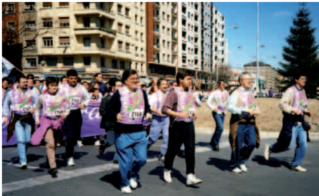
Korrikaren lekukoarekin, 1995ean