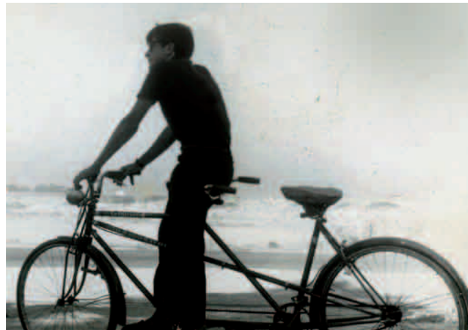
Gaztetan, haien tandem famatuarekin