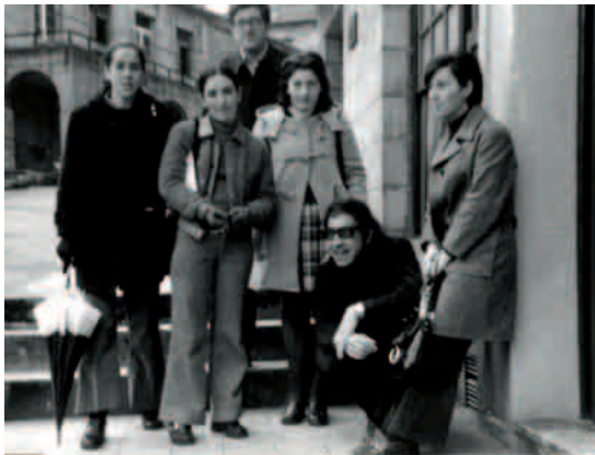
Gernikan, ikastolako irakasleekin