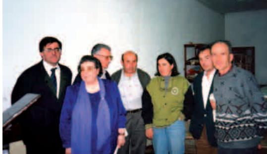
Etniker taldearekin, 2006an