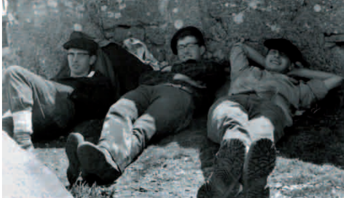
Euskal Jai batean