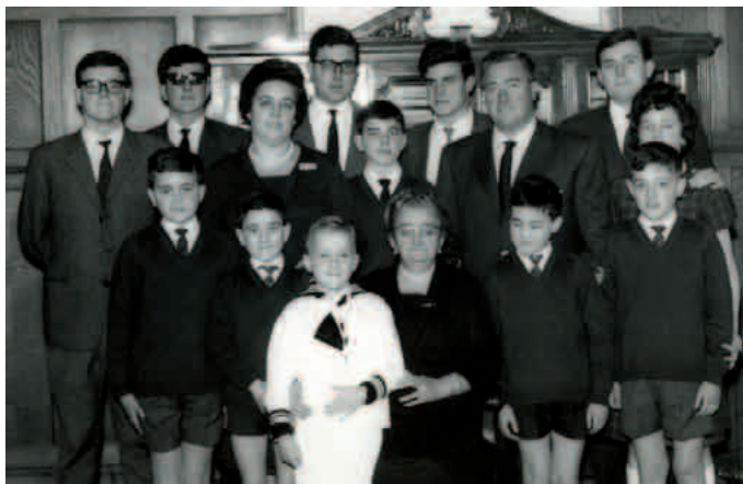
Familia osoa. 11 anaia eta arreba bat